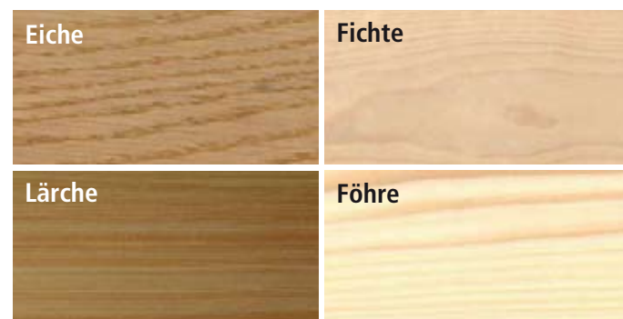
Andere Holzarten auf Anfrage

NIEDERMANN HOLZ GMBH, DER FACHBETRIEB FÜR ROH- UND HALBFABRIKATE IN HOLZ, BIETET LÖSUNGEN FÜR ARCHITEKTONISCHE MEISTERLEISTUNGEN.