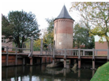
Pfähle von Schlossbrücke, Schagen (NL)