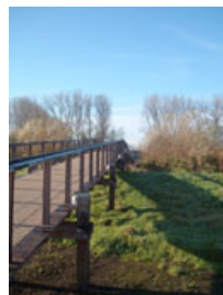
Pfähle von Brücke, Fort Wiericke Schans, Bodegraven (NL)