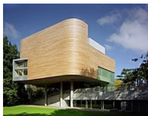
Fassadenverkleidung von Cork Universität (IRE)