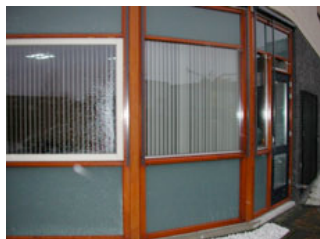
Lakierte Fensterrahmen in einen Bürogebäude in Reeuwijk (NL)