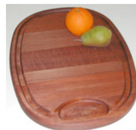
Küche und Scheidebrett