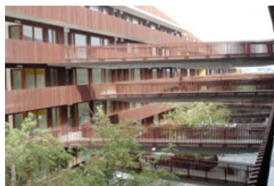
Fassadenverkleidung und Zaun von 150 Appartements, Utrecht (NL)