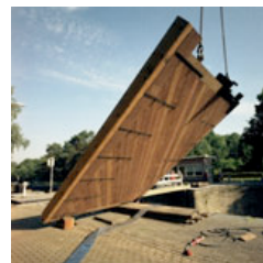
Schleusentore in Tilburg (NL)