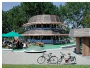
Fassadenverkleidung in Amsterdam (NL)