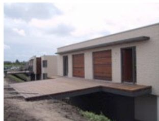
Vlonders in Roosendaal (NL)