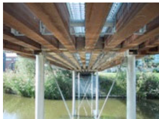
Brugconstructie in Amsterdam (NL)