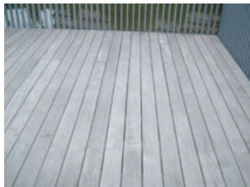
Holzdeck bei Theater, Zwolle (NL)