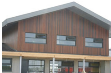
Fassadenverkleidung, Zuiderburen (NL)