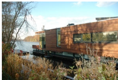
Wohnschiff, Loenen a/d Vecht (NL)