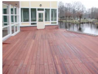
Terrassendielen, Waterstein, Woerden (NL)