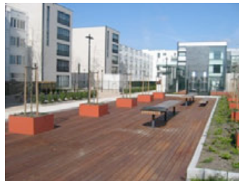
Holzdeck, IJburg (NL)