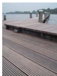
Terrassendielen in Reeuwijk (NL)