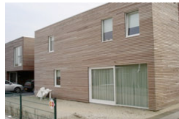
Wohngebiet, Floriande-Nord, Hoofddorp (NL)