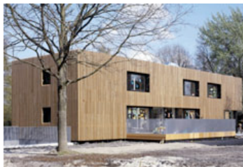
Fassadenverkleidung von Kinderkrippe, Uithoorn (NL)