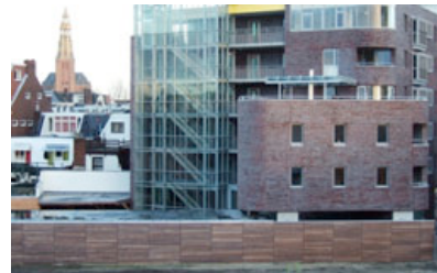
Fassadenverkleidung, Westerdock, Groningen (NL) Foto MAD architecten