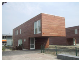
Fassadenverkleidung, Floriande, Hoofddorp (UK)