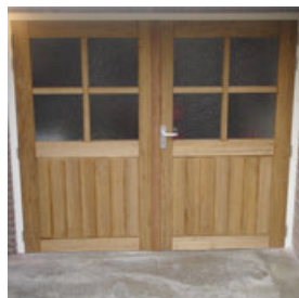
Türen in home, Katwijk (NL)

Schwerpunkte Schnittholz aus Nordamerika und Europa FSC-zertifiziertes Holz Fensterkanteln lamelliert