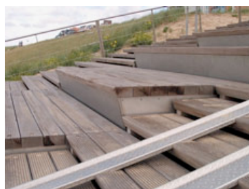
Standtreppe bei Egmond aan Zee (NL)