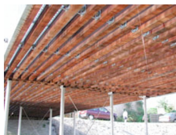
Brückenkonstruktion in Amsterdam (NL)