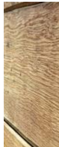
Im Längsschnitt sind in den Bohlen und Brettern die kleinen runden Bohrlöcher sichtbar, die dem Holz die antike Note geben.