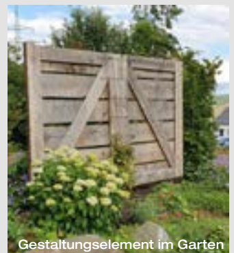
Gestaltungselement im Garten

Weitere Beispiele finden Sie auch unter: www.feldmeyer.de