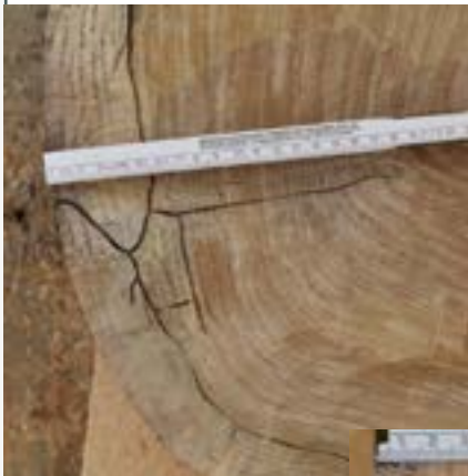
Im Querschnitt sind die Fraßgänge des Eichenkernkäfers bis in das Kernholz deutlich erkennbar

In diesen Fraßgängen siedeln sich Ambrosiapilze an, die dem Käfer und seinen Larven als Nahrung dienen. Aus diesem Grund befällt der Eichenkernkäfer nur feuchtes bzw. lebendes Holz.