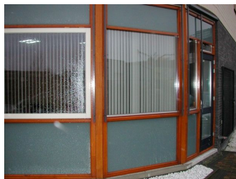
Lakierte Fensterrahmen in einen Burogebäude in Reeuwijk (NL)