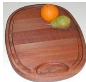
Küchen- und Schneidebrett