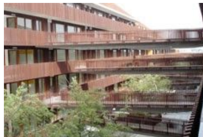
Fassadenverkleidung und Zaun von 150 Appartements, Utrecht (NL)