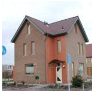
33 Hauser, Vleuterweide