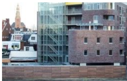
Fassadenverkleidung, Westerdock, Groningen (NL)